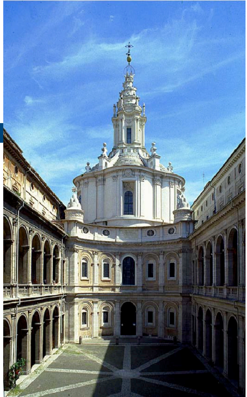
Morante - Musei e biblioteche