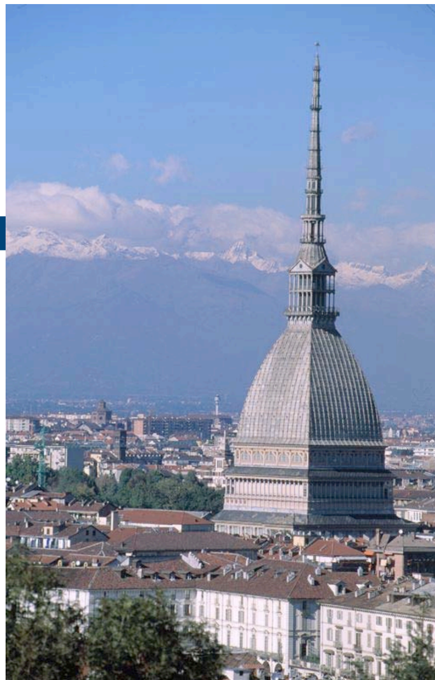
Morante - Musei e biblioteche