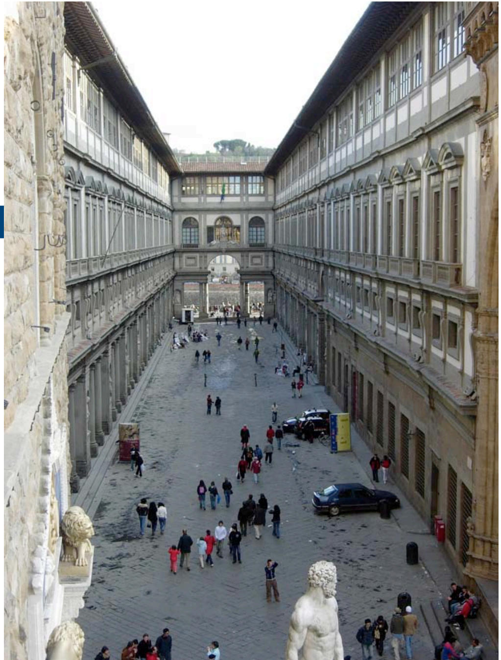
Morante - Musei e biblioteche